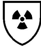
图 3 防电离辐射图形标识